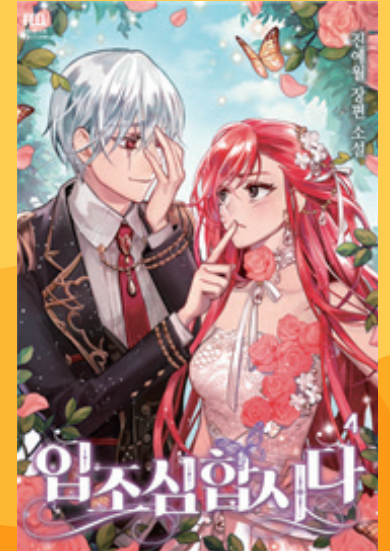
웹툰웹소설과 외래교수 진예월