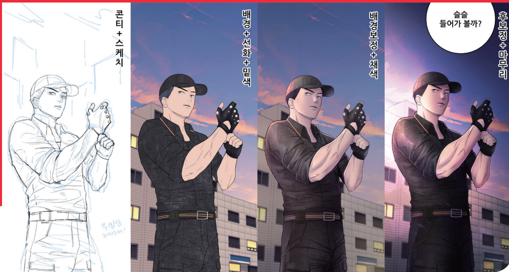
졸업생 작품 _ 웹툰 '이번생은 빌런이다' (카카오페이지)

전통적인 출판시장은 침체되는 반면 지식정보 콘텐츠 플랫폼이 대세로 자리매김하며, 기존 출판 생태계는 웹과 모바일 중심으로 급속도로 이동하고 있음에 따라 수성대학교 웹툰스토리과는 웹소설, 웹툰, 웹드라마 등 웹문화 콘텐츠 분야에서 창의적인 세계관을 갖춘 웹콘텐츠 기획 및 제작 전문 인력을 양성합니다.