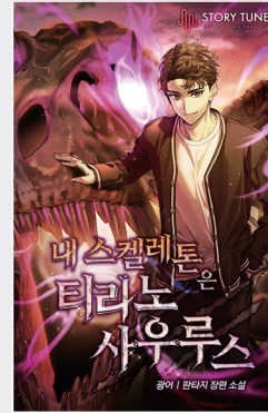
재학생 작품 웹소설 '내 스켈레톤은 티라노사우루스' (카카오페이지)