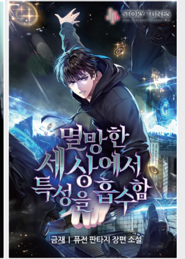
졸업생 작품 웹소설 '멸망한 세상에서 특성을 흡수함' (네이버 시리즈)